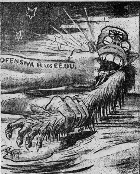
Pacher en el Pittsburgh Post-Gazette.