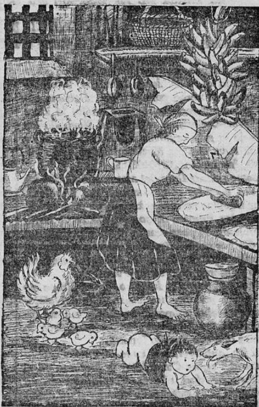
LA COCINA TIPICA COSTARRICENSE, DONDE SE SAZONAN LAS MAS EXQUISITAS VIANDAS

Paralelamente a la organización se ha desarrollado la instrucción de mandos y tropas, en múltiples Centros de enseñanza militar, polígonos de tiro, y en campos de maniobras cuidadosamente elegidos y de áreas tan grandes que en ellos pueden desarrollarse ejercicios de doble acción con intervención de todas las armas, y, con tal realismo, que a menudo se producen bajas definitivas entre el personal ejecutante. En estos ejercicios y maniobras en gran escala, que, de mane-