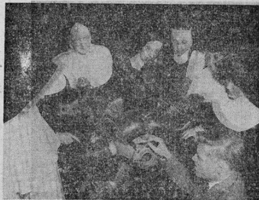
Grupo de monjas católicas que frecuentan un curso de aviación de doce semanas en la universidad de Detroit. Después de haberse familiarizado con el funcionamiento del motor y haber aprendido los principios de la meteorología, de la navegación de la aerodinámica, etc., las religiosas son destinadas a diferentes colegios de los Estados Unidos con el fin de que enseñen los rudimentos de la aviación militar a las jóvenes norteamericanas.